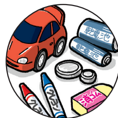
文具、おもちゃ、電池