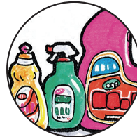
洗剤・洗浄剤、漂白剤